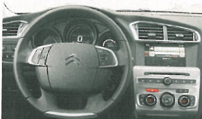
Větší volant může urostlejšími řidičům trochu vadit, multifunkční ovládání je ale velmi praktické