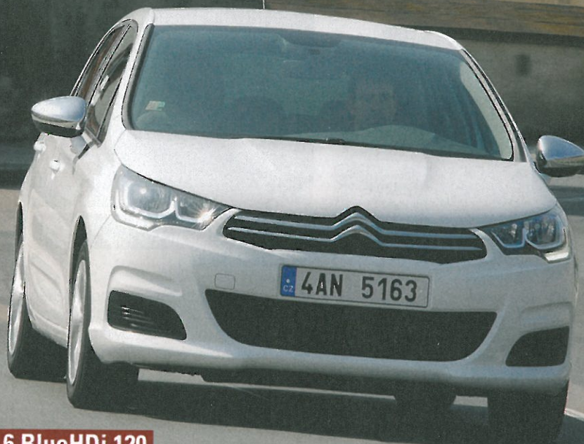
Citroën C4 1.6 BlueHDi 120