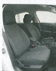
Sedáky vpředu jsou dostatečně dlouhé i široké, boční vedení nám ale přišlo slabé. I díky rozvoru 2608 mm nabízí C4 cestujícím vzadu dostatek prostoru pro nohy.