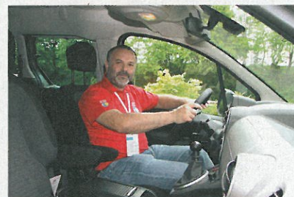
Opět jsme si osvěžili, jak příjemně se berlingo řídí. Sedadla jsou pohodlná a je z něj dobře vidět.